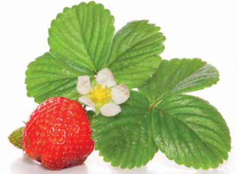
Harmaahomeen torjuntakoe Ruotsi, 2015