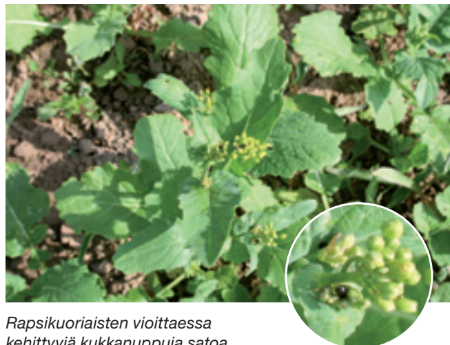
Rapsikuoriaisten vioittaessa kehittyviä kukkanappuja satoa tuottavia lituja muodostuu vähemmän.

Bayer Oy, Bayer CropScience Keilaranta 12, PL 73, 02151 Espoo, puh. 020 785 21 www.bayercropscience.fi, www.bacsmobil.fi