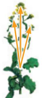
Biscaya suojaa uuden kasvun

Biscaya voidaan ruiskuttaa sääolojen salliessa myös päivällä, koska tehoaine pysyy kasvisolukossa antaen pitkävaikutteista suojaa.